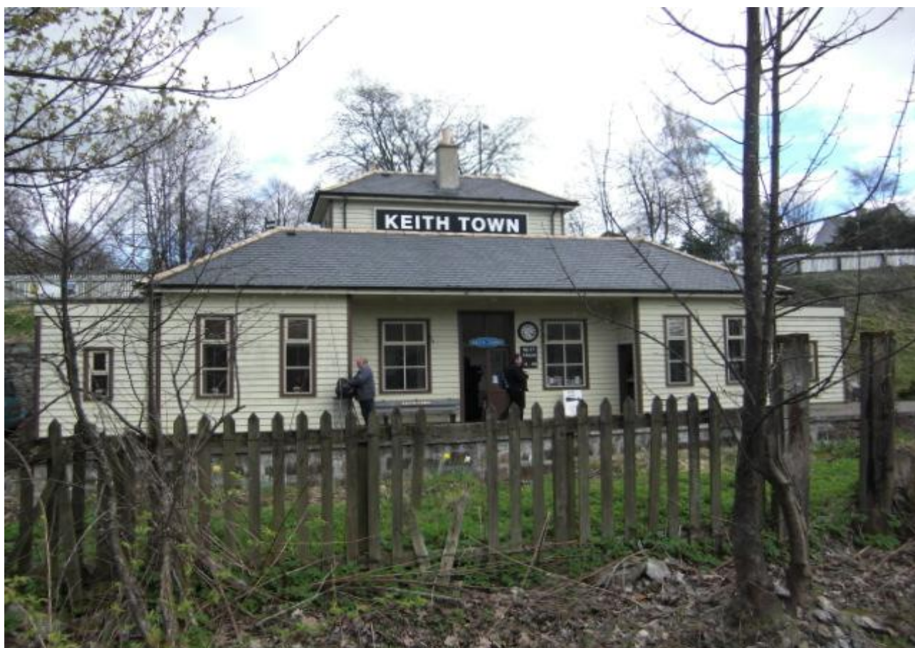
Stationsbygningen i Keith

Hvis man bor i Dufftown, og af en eller anden grund ikke føler at det er den rigtige dag at tage bilen, så findes der et fantastisk alternativ. Mellem Dufftown og Keith, drives en jernbanestrækning med et veterantog. Selve turen tager én gennem et fantastisk smukt landskab, og flere destillerier passerer ligeledes på vejen. Den ældre konduktør kan andet end kontrollere billetter, han sørger nemlig for at fylde lidt whisky i passagerernes glas undervejs ☺